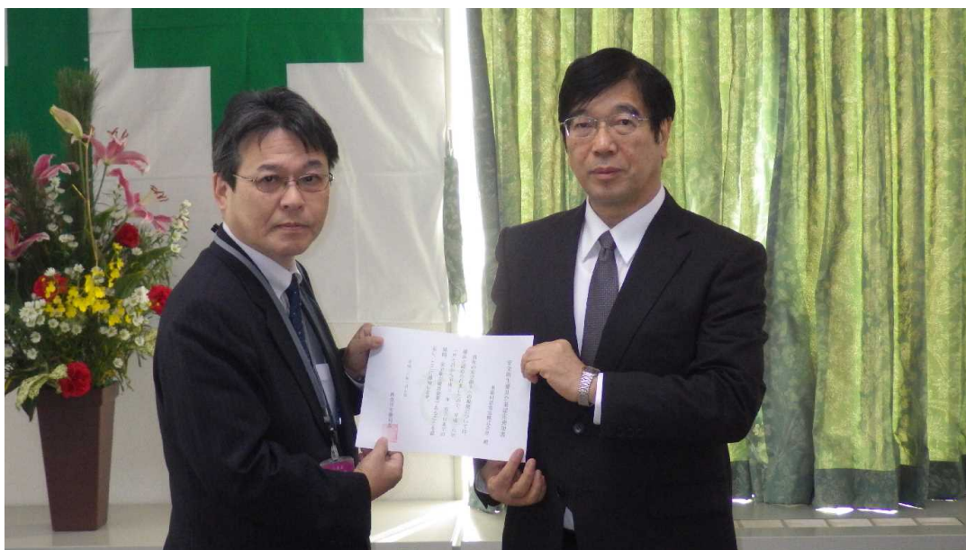
▲若生神奈川労働局長から認定通知書を受け取る町田社長（左）