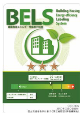
〔図1〕 ガイドラインに基づく第三者認証の例

また、ダイヤモンドリスponsに対応した時間帯別・季節別の電気料金メニューが選択できる場合はその活用に努めるとともに、エネルギー管理システム（BEMS・HEMS等）の導入により、ビルの運用方法、住宅の住まい方の改善によるピーク対策及び省エネルギーに努めること。