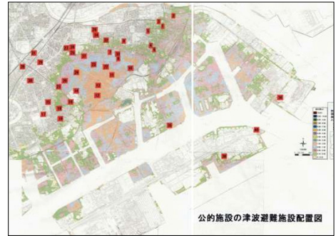
川崎市浸水予想(■は公的津波避難施設)

【日時】 平成24年8月23日(木) 14:30 - 16:30 【場所】 川崎市労働会館(サンピアン川崎) 4F第3会議室 川崎区富士見 2-5-2 TEL 044-222-4416