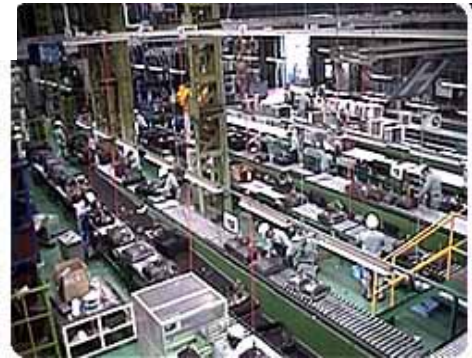
テルムの家電リサイクル工場

近隣4県から集まる年間50万台以上のテレビ、エアコン、洗濯機、冷蔵庫を解体・破碎して原料別に選別するリサイクル工場。