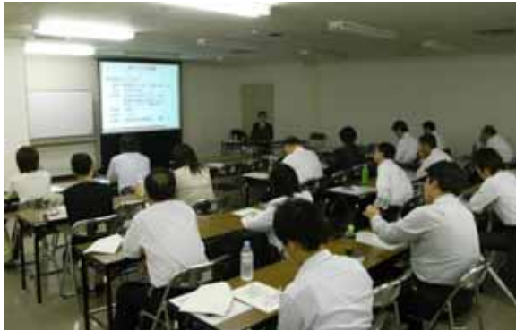
ユニクロの人事思想

ユニクロでは柳井社長の信条「会社と個人は対等」の考え方が人事制度に大きく反映されている。自立・自律した個人が協働しながら高い付加価値を創造し高い処遇を実現する。成長しようと努力する人を応援する会社である。