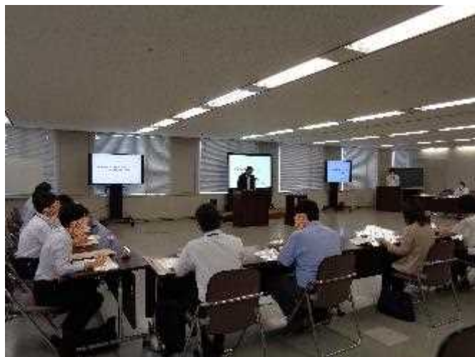
※一部画像を加工しています。